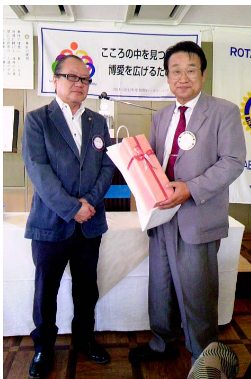
相澤会員、お誕生日のお祝い